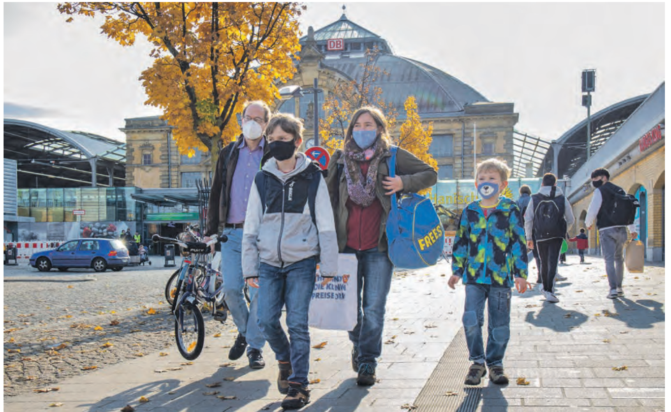
In allen öffentlichen Bereichen innerhalb des Innenstadtringes, auf der Leipziger Straße sowie auf dem Hans-Dietrich-Genscher-Platz vor dem Bahnhof gilt seit dem 22. Oktober Maskenpflicht.

Eröffnet wird die Ausstellung im Internet am Montag, 9. November , 17 Uhr. Neben den Eröffnungsansprachen, unter anderem von Bundesaußenminister Heiko Maas, ist ein Film zu sehen, der die sieben Orte virtuell verbindet. Die Ausstellung bietet einen vertiefenden Einblick in die Geschichte der sieben ausgewählten Orte jüdischen Lebens, wie sie entstehen, sich verändern, wie sie im Novemberpogrom von 1938 zum Teil zerstört und später erneut mit Leben erfüllt werden. Die Plattform soll sich stetig weiterentwickeln. So ist geplant, weitere Orte aufzunehmen und die Inhalte zu ergänzen. Die Ausstellung im Internet: www.7Places.org