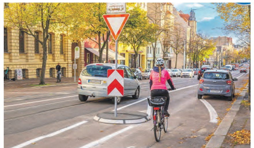
Radfahrer haben stadteinwärts nun eine eigene Fahrspur.

Weitere Optimierungen sind im Rahmen der „Konzeption für eine weitestgehend autofreie Altstadt Halle (Saale)“ geplant, die derzeit in den Gremien des Stadtrates beraten wird.