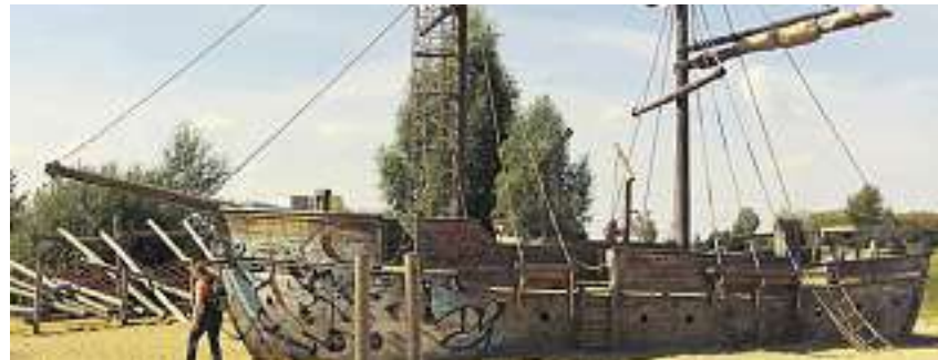
Bietet besten Kletter- und Abenteurerspaß – das Piratenschiff nahe Lilienstraße und Blücherstraße.

Ausflugsideen aus dem Buch „Mit Kindern auf Tour“ / Freibeuterfeeling zwischen Lilien- und Blücherstraße