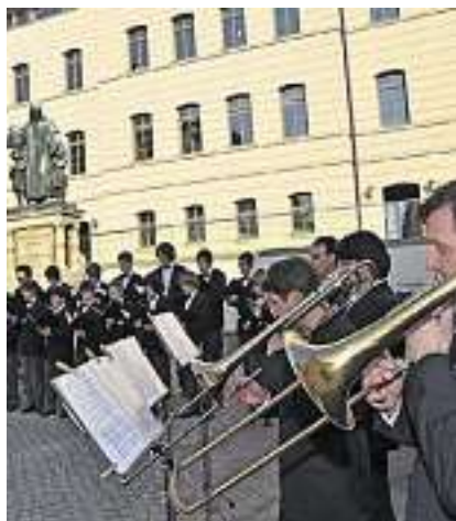
Musiker der Latina und des Stadtsgenchores bringen das Geburtstagsständchen.