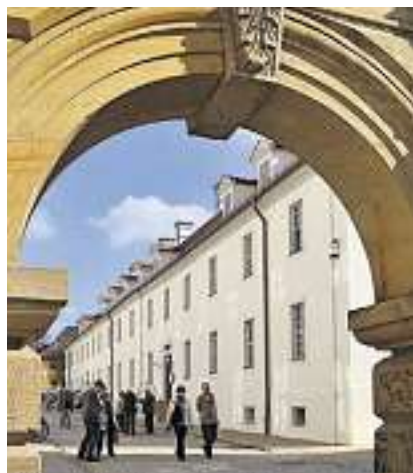
Blick durchs Tor auf das sanierte Back- und Brauhaus.

Einmalige Präsente zum Geburtstag / Stiftungen feiern August-H. Francke und Abschluss mehrerer Bauprojekte