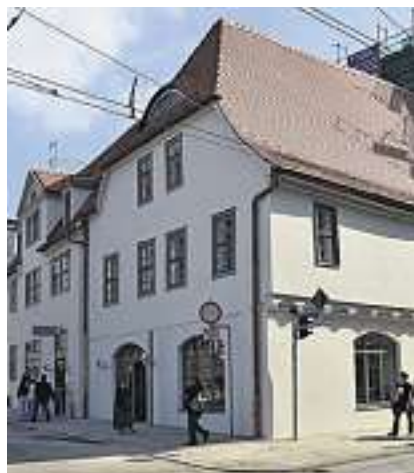
Sanierte Ecke: Waisenhausbuchhandlung und Bistro „Tranquebar“.

Welch Präsente zum Francke-Ehrentag. Traditionell luden die Franckeschen Stiftungen am vergangenen Wochenende zum Geburtstag August Hermann Franckes (1663-1727) ein. Diesmal standen die Feierlichkeiten im Zeichen der Vollendung dreier großer Bauprojekte, die den Eingangsbereich der Stiftungen nun nahezu komplettieren – Back- und Brauhaus, die ehemaligen Pächterhäuser der Meierei, Bistro „Tranquebar“ und die Waisenhausbuchhandlung. Damit ist den Stiftungen ein wesentlicher Schritt auf dem Weg zum Unesco-Welterbe gelungen. Seit 1998 stehen sie auf der Tentativliste. Bis 2015 gilt es, den Antrag für die Aufnahme einzureichen.