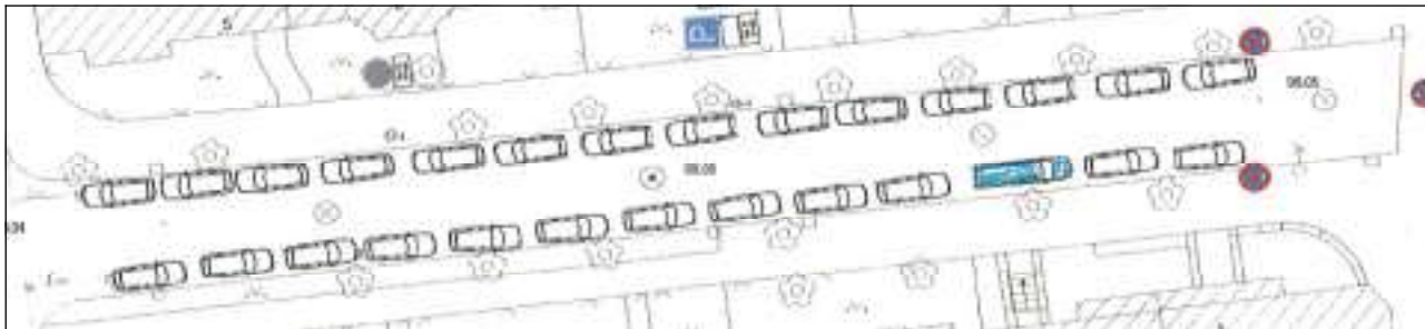
Das Parkregime in der Längsvariante würde bis zu 27 Kraftfahrzeugen Platz bieten.