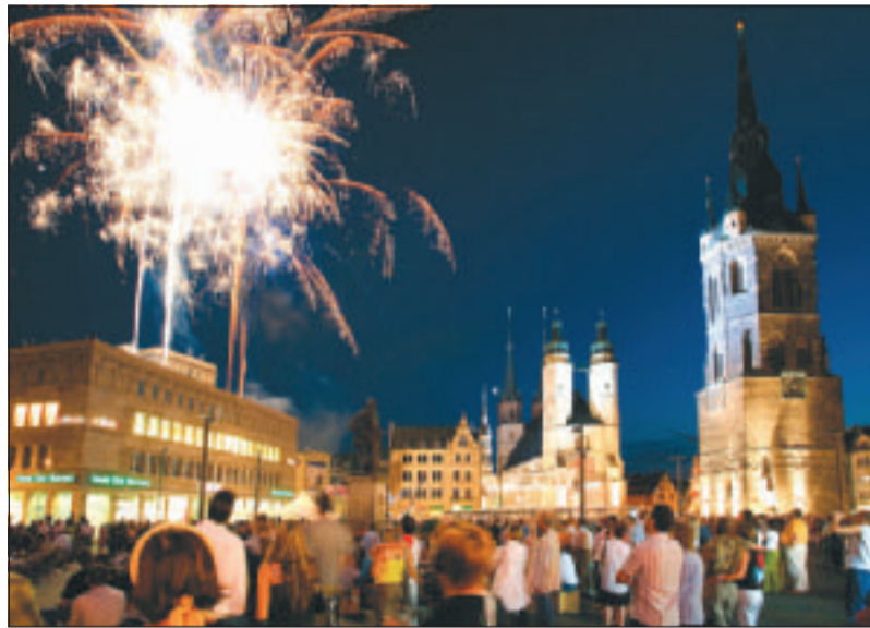
Nicht nur einmal erstrahlte Halles ehrwürdiger Markt im Jubiläumsjahr im funkelnden Lichterglanz.